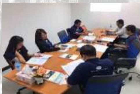
ตรวจประเมิน