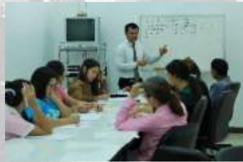
ดูแลรักษา ปรับปรุงระบบ