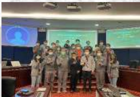
ที่ปรึกษา