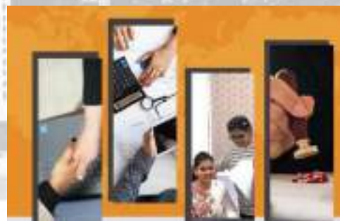
ตรวจให้การรับรองโดย พาร์ทเนอร์ของเรา